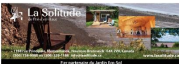
1188 rue Principale, Memramcook, Nouveau-Brunswick, E4B 3Y6, Canada 506-738-9080 ou 506-735-1188 info@la-solitude.ca www.la-solitude.ca Fier partenaire du Jardin Éco-Sol